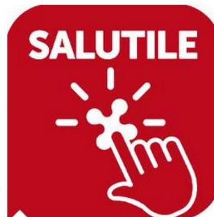
Salutale Pronto Soccorso