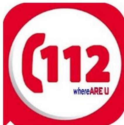
App "112 Where Are U"